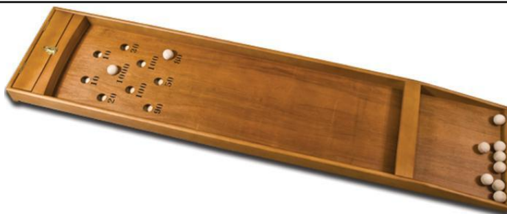
Billard classique avec boîte de rangement pour les boules